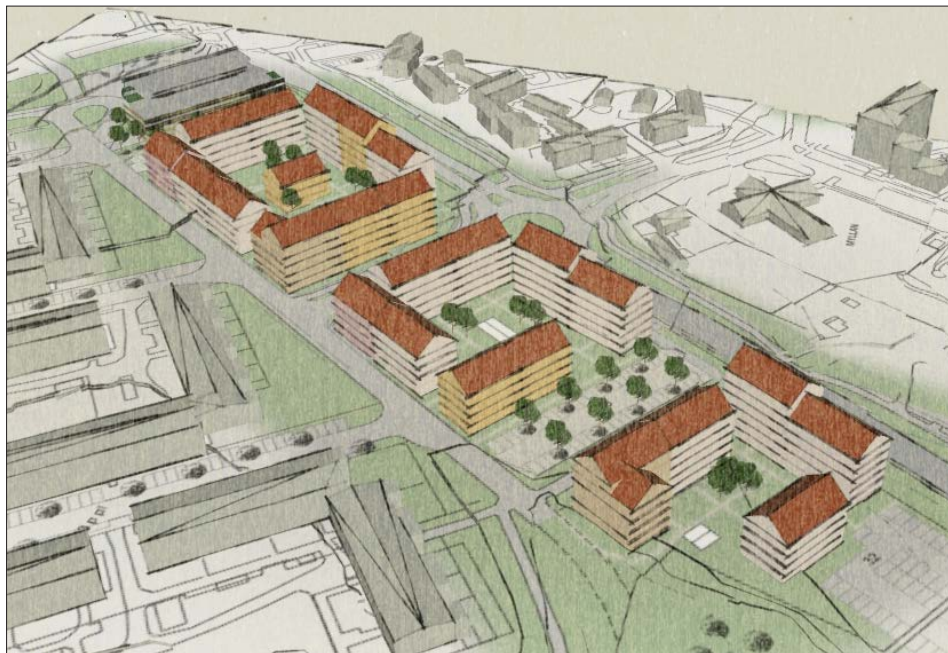
Skiss av planförslaget, vy från sydväst